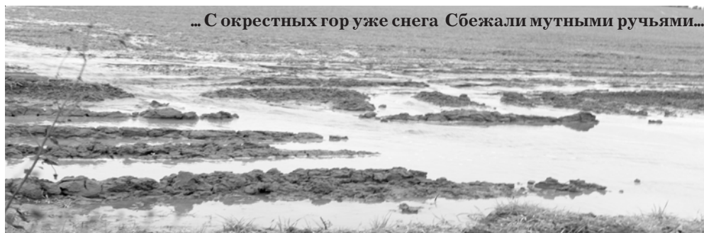
... С окрестных гор уже снега Сбежали мутными ручьями...

НАЧАЛАСЬ ОСНОВНАЯ ПОДПИСКА на районную газету «Большесельские ВЕСТИ» на 2 полугодие 2016 года Газету можно выписать во всех отделениях почтовой связи, а также у почтальонов.